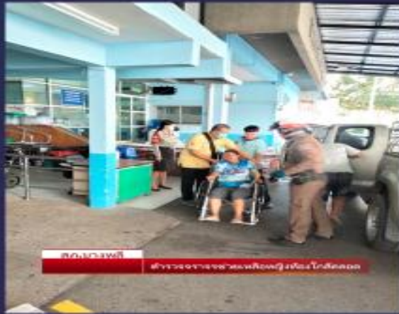
รพ.บางพลี ตำรวจจราจรพาแม่ท้องถึง รพ.ใกล้คลอด

เจ้าหน้าที่งานจราจรจึงเข้าไปช่วยขับรอนำทางหญิงตั้งครรภ์ใกล้คลอดไปยัง รพ.บางพลี จนถึงที่หมายอย่างปลอดภัย